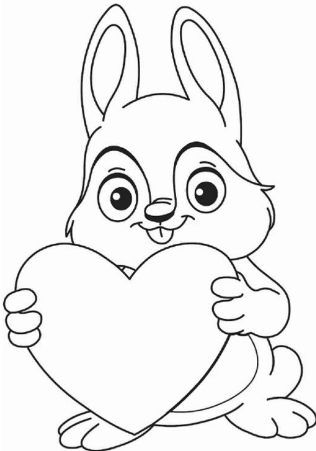
Идея для поздравительной открытки-валентинки